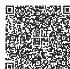
(五) 重大公益慈善项目收支明细表